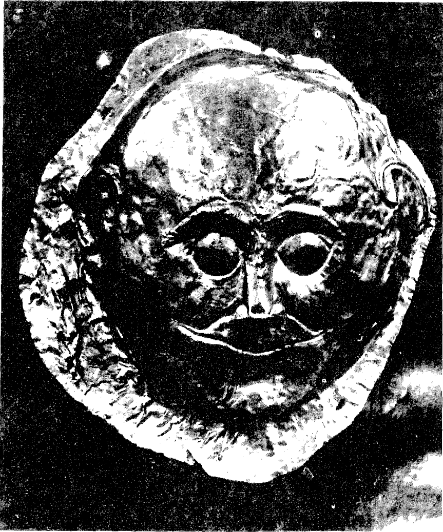
شكل ٣ - قناع من الذهب . جاء من مقابر المجموعة الأولى .